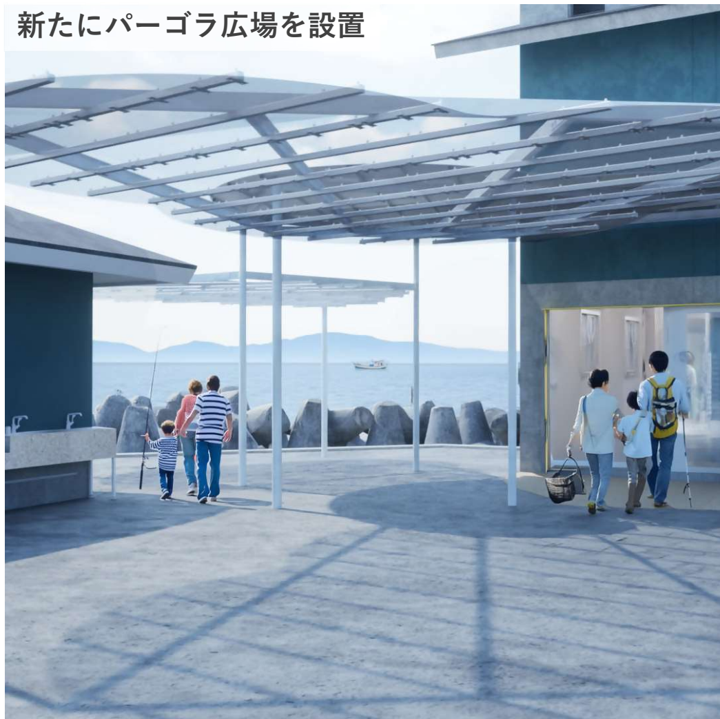
新たにパーゴラ広場を設置