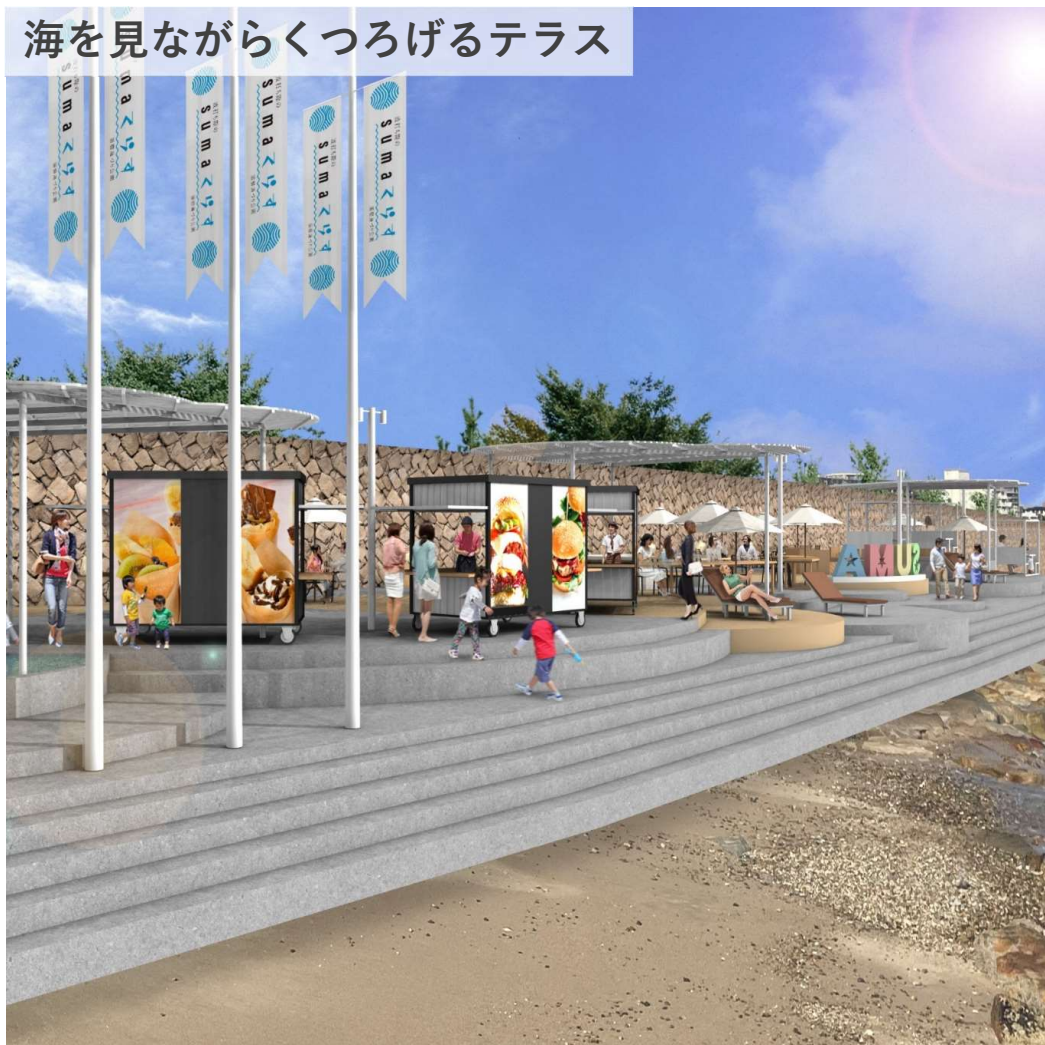
海を見ながらくつろげるテラス