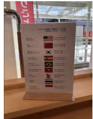
通訳サービス提供の多言語表示板