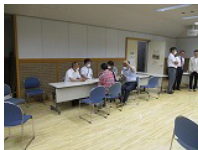
まちづくり協議会ブース