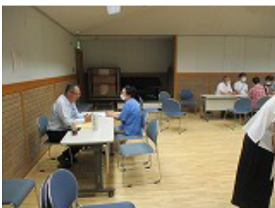
コンサルタントブース

議事終了後に、神戸市より土地区画整理事業の進捗状況の報告がありました。総会終了後は、「まちづくり協議会」「コンサルタント」「神戸市」の個別相談ブースを設けて、ご質問やお悩みなどをお聞きしました。会場の利用時間いっぱいまで、みなさんと直接お話しすることができ、有意義な機会となりました。