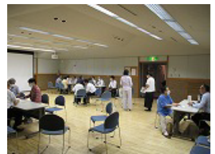
会場全体と神戸市ブース