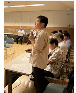
各議案を説明する役員