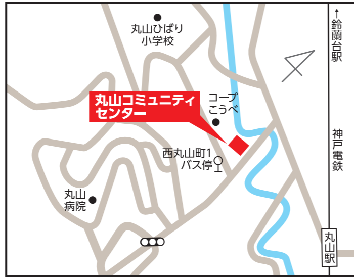
丸山コミュニティセンター 【長田区西丸山町1-7-5】